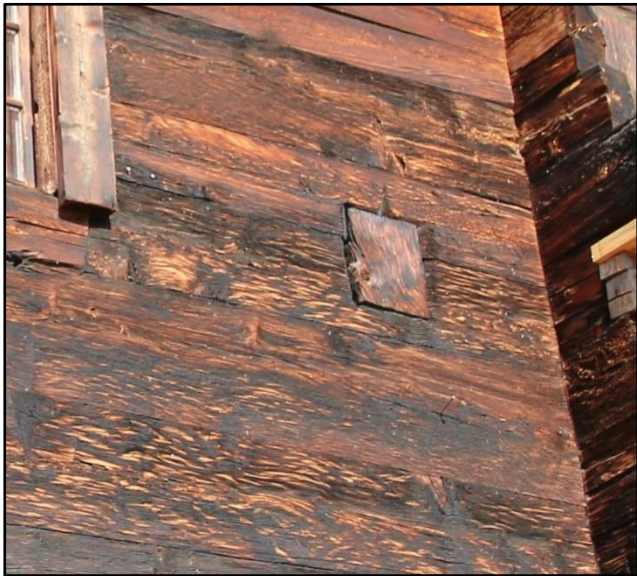
Gotischer «Seelugglozz» an einer Hausfassade