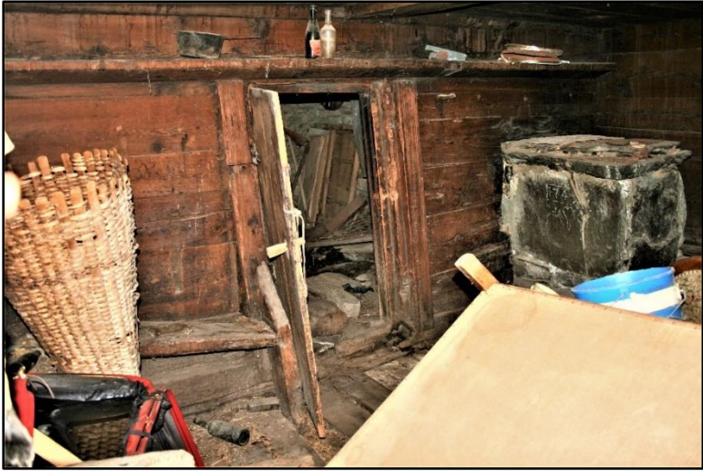
«Seelubank» an der Wand beim Giltsteinofen