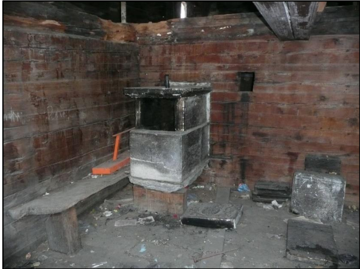
«Seelugglozz» in der Nähe des Giltsteinofens